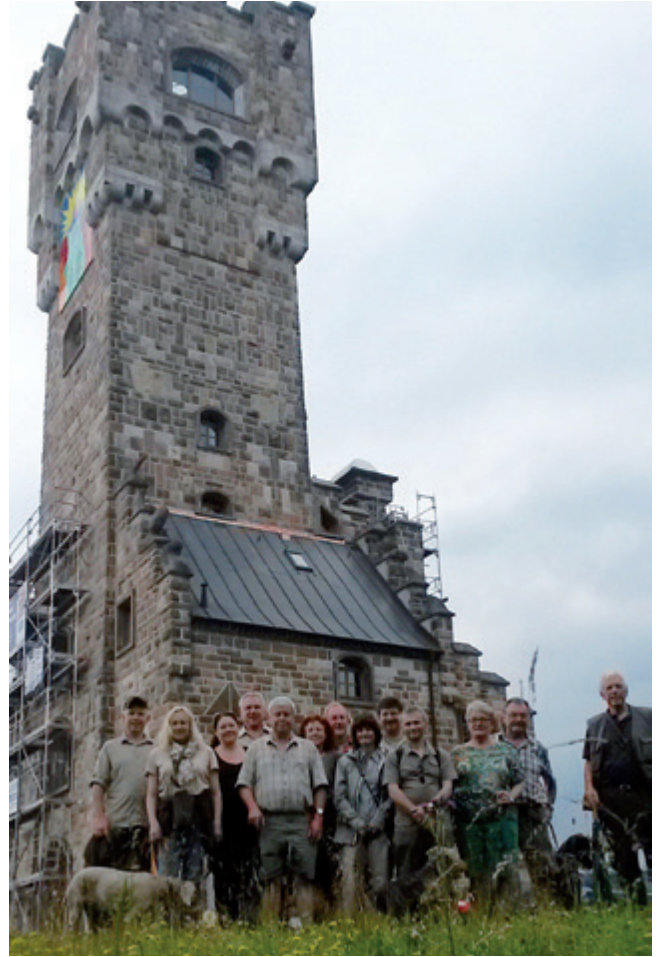
Starke Truppe: Die Fürther Jagdhornbläser vor dem leider in Gerüste gehüllten Altvaterturm