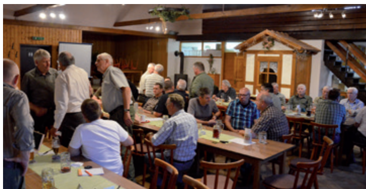
Der gut gefüllte Saal im Gasthaus „Zum Schwarzen Bock“ in Unterschlausersbach

Das Angstgeschrei wird von stabilen, älteren, territorialen Rehen als Hilfeschrei aufgefasst, das sie dazu veranlasst nachzusehen und dem bedrängten Stück zu helfen, z.B. um eine Fuchs oder einen aufdringlichen, intoleranten Bock zu vertreiben. Es versetzt den ganzen Rehwildbestand in Aufruhr. Er