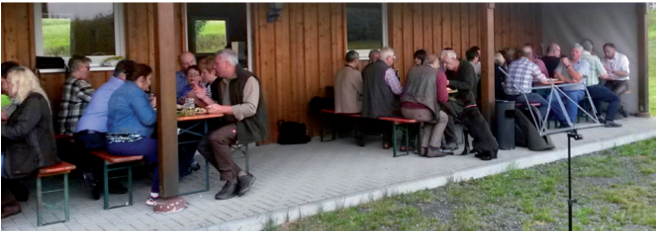
Geselliges Beisammensein mit den Jagdgenossen aus Effelter