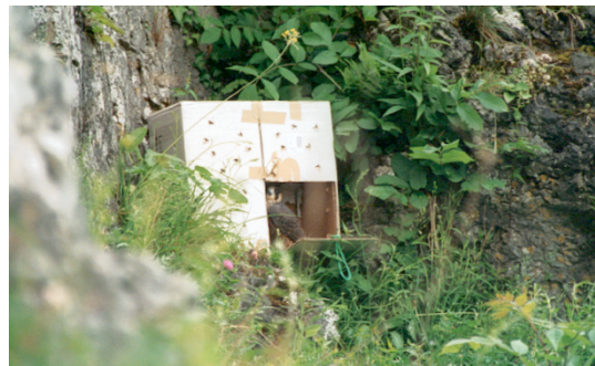
im Wiesenttal ausgesetzte Jungfalken

Damit die Jungfalken in der nächsten Brutsaison gefahrlos ausfliegen konnten, galt es den Brutplatz "wanderfalkengerecht" umzubauen. Die Genehmigung hierfür wurde vom Pfarramt gerne erteilt. Dank einiger Spenden konnte das Material für einen größeren Nistkasten besorgt werden und eine Schlosserei mit der Herstellung eines Anflugrostes aus Edelstahl beauftragt werden.