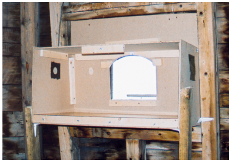
der neue Nistkasten