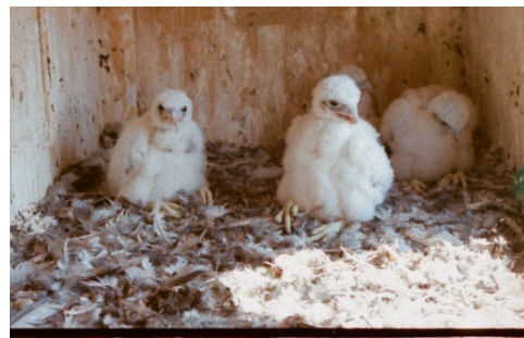
ca. 14 Tage alt

Fürsorge ihrer Eltern wuchsen sie schnell heran und konnten problemlos ausfliegen.