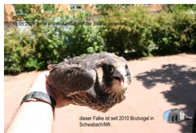
FZ 5 seit 2010 Brutvogel in Schwabach